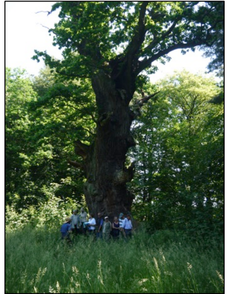
Oben: Vor der Starkeiche im Park Bischofswald; unten: Übersichtskarte Exkursionsgebiet

Hier musste die etwa 400jährige, immer noch grüne Starkeiche direkt an der Straße, wie schon bei der Februarexkursion, für das Abschlussfoto erhalten.