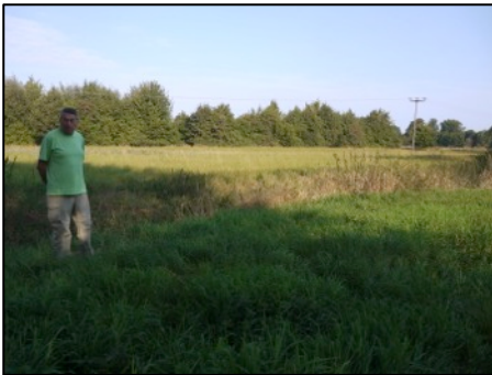
Olbe-Grünland kurz oberhalb der Feldmühle

Zunächst querten wir ein parkähnliches Gehölz. Schade, dass kein Einheimischer dabei war. Sicher hätten wir dann mehr darüber erfahren. Dann ging es in die Grünland-Aue. Ein Großteil der Flächen, insbesondere die Heckenstrukturen zur Abgrenzung gegen das Ackerland wurden als Kompensationsmaßnahmen im Zuge der Autobahnverbreiterung Ende der 1990er Jahre angelegt. Inzwischen haben die Gehölzpflanzungen beträchtliche Ausmaße erreicht und sehen gar nicht mehr angepflanzt aus. Das Grünland bis zur Feldmühle ist zwar nicht übermäßig blütenreich, konnte aber doch als recht naturnah angesprochen werden.