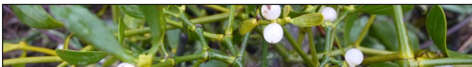
Von oben nach unten: Wiesengoldstern, Klatschmohn, Wiesenflockenblume, Schlehe, Mistel