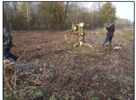
Oben: Pflegehieb oder Frevel?; unten: Biberschnitte

Im Weiteren ging es dann über eine Offenfläche, die vor Kurzem bearbeitet wurde. Ob die Gehölzrückschnitte am Waldrand, die fast vollständige Beseitigung der Ohre-Ufergehölze und der teilweise Wiesenumbruch (mit Neueinsaat?) mit den Schutz-/Erhaltungszielen des Schutzgebietes vereinbar und keine Ordnungswidrigkeit sind, blieb offen. Am Rande der Ohrewiesen ging es zurück zum Ausgangspunkt.