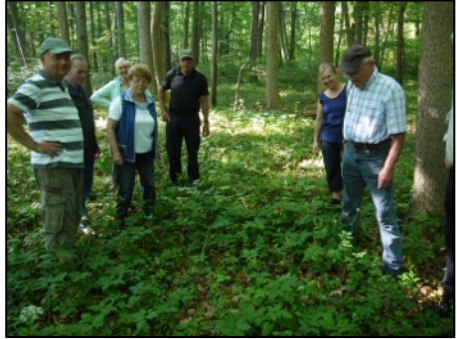
Oben: Am Orchideenstandort; unten: Stattliches Knabenkraut (schon fast verblüht)

mengewächs), fruchtender Waldmeister (kleine Klettfrüchte), Waldsarnikel (weißer Doldenblütler), Schattenblümchen (weiß, ohne Blüte ein Blatt, mit Blüte zwei Blätter).