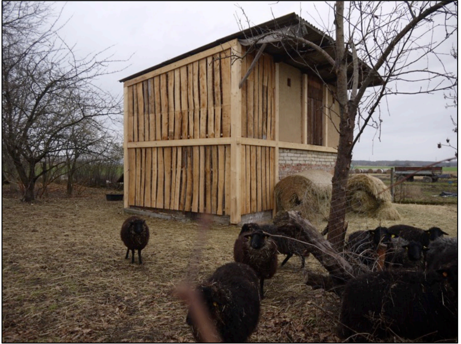
Oben: Bauzustand Ende Januar 2016; unten: Südansicht nach endgültiger Fertigstellung