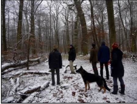
Oben: Bei den „Sieben Eichen“; unten: Am Holzauktionsgelände; rechts: Eine der zusammengebrochenen Eichen im Park Bischofswald

alten Kultplatz handelt. Noch ein Blick in das angrenzende Flachmoor (Vorkommen von Springfrosch und Brutgebiet des Kranichs), und dann ging es weiter in Richtung Bischofswald.