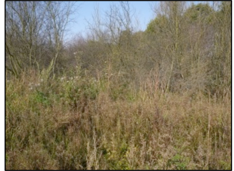
Oben: Durch Überstauung abgestorbene Gehölze; unten: Biberstau direkt oberhalb der Autobahnbrücke

Als Rückweg wurden dann die vorhandenen Wege genutzt. Zwischenzeitlich waren die angekündigten hochsommerlichen Temperaturen erreicht und eine Wanderung durch die Fläche keine Freude mehr.