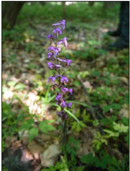
Gelegentlich wurde durch Michael Wetzel auf die charakteristischen