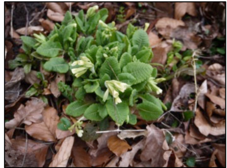
Oben: Hohe Schlüsselblume; unten: Märzenbecher

Trollblume (Hahnenfußgewächs) soll es hier früher gegeben haben. Ein aktueller Nachweis ist nicht bekannt. Von der Tiefen Wiese aus ging es weiter beberabwärts. Im angrenzenden Erlenbruch wurden die ersten, noch ziemlich kleinen Primelblüten entdeckt. An der rein hellgelben Farbe war zu erkennen, dass es sich um die Hohe Schlüsselblume handelt. Die verwandte Wiesenschlüsselblume, die auf eher trockenen Standorten zu finden ist, hat rote Punkte auf den Kronblättern.