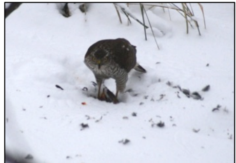
Sperber, Foto: Gunter Tschuschner

69 Fotos eingesendet. Die reichten von einfachen Schnappschüssen bis hin zu profihaften Nahaufnahmen, von einem ganz normalen Meisenbesuch bis zu Futterneidauseinandersetzungen.