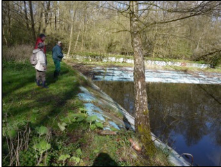
Am ehemaligen Krepebad

Dann fiel der Blick auf eine Eiche, die schon ziemlich weit ausgetrieben hatte. Mit Verweis auf die alte Bauernregel „Kommt die Eiche vor der Esche, gibt es eine große Wäsche.“ konnte man auf den Eschenaustrieb, der im weiteren Exkursionsverlauf bestimmt noch zu beurteilen sein würde, gespannt sein.