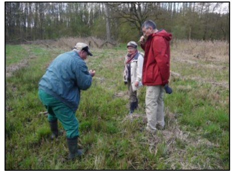
Geruchsprobe am Kleinen Baldrian

In der Mitte des Quellgebietes befindet sich eine Nasswiese. Hier wurden typische Pflanzen gezeigt: Kleiner Baldrian (Wurzelbereich duftet etwas), Bachnelkenwurz, Sumpfkatzdistel, Milzkraut.