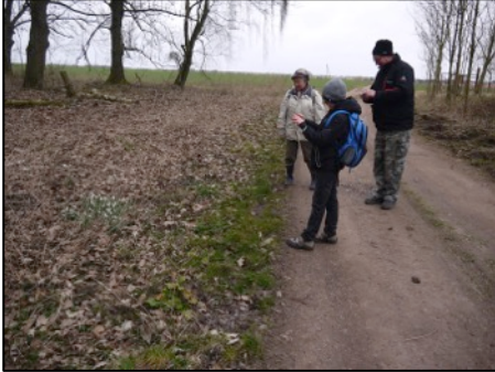
Schneeglöckchen am Wegrand

Für den 20. März hatten wir zu unserer ersten Frühjahrsexkursion eingeladen. Ziel war die Flur südöstlich von Bregenstedt. Geplant war ein Rundkurs, die obere Beber abwärts und zurück entlang der Krummbeek.