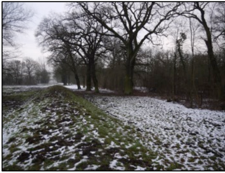
Oben: Alteichen im ehemaligen Gaststättenbereich; Mitte: Schrote an der Mittellandkanalunterführung; unten: Ein Fuchsberg-Hügel