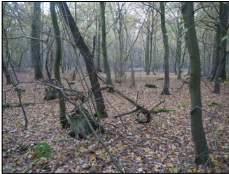
Oben: LRT 9160; unten: LRT 91E0

gutachten der Bestände war dies durchaus nachvollziehbar.