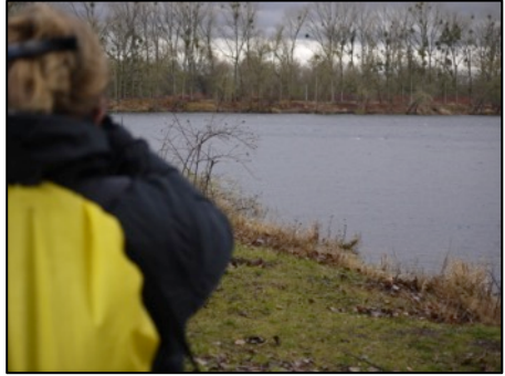
Oben: Beobachtung von Schellenten; unten: Silberreiher

Überraschend zahlreich war dann doch, was auf und an der südlichsten Gewässerfläche zu beobachten war: Silberreiher, Graureiher, Stockenten, Höckerschwäne und ein ganzer Trupp Gänsesäger. Auch vier Zwergtaucher waren fleißig beim Tauchen.