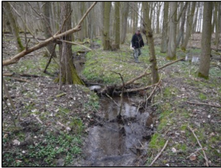
Oben und unten: Naturnaher Bachverlauf der oberen Beber

dene, meist noch spärlich austreibende bzw. noch aus dem Vorjahr vorhandene krautige Pflanzen, wie zum Beispiel die Große Brennnessel, die Große Klette, den giftigen Aronstab oder das im jungen Zustand als Salat nutzbare Scharbockskraut. Die angekündigten Märzenbecher wurden erst später, abseits der Beber entdeckt.