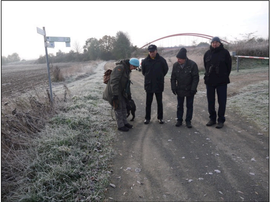
Am Beginn der Rundtour

Exkursionsziel am 13. November war das Schierholz nördlich von Wieglitz. Das Gebiet ist Bestandteil des Fauna-Flora-Habitat-Gebiets (FFH) Klüdener Pax-Wanneweh und des gleichnamigen Naturschutzgebiets. Schutzziel sind insbesondere Wald- und Hochstaudenlebensraumtypen (LRT). Bekannt sind auch wenige Orchideenvorkommen.