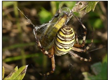
Wespenspinne mit Grashüpfer

Unterhalb der Feldmühle ist die Aue durch die Tätigkeit des Bibers geprägt. Trotz Trockenheit war der Uferbereich überflutet. Weiter unterhalb wurde durch die Exkursionsteilnehmer deshalb ein Biberstau vermutet. Den galt es zu finden. An der Vegetation der Grünlandflächen war deutlich zu erkennen, dass hier im Frühjahr wohl „Land unter“ war: flächendeckend Breitwegerich und Bitterkraut und mitten auf der Wiese Uferpflanzen wie Zweizahn und Wolfstrapp. Im Bitterkrautbestand wurde dann eine Wespenspinne entdeckt, die einen Grashüpfer gefangen und eingesponnen hatte: ein tolles Fotomotiv. Allerdings wollte uns die Spinne immer nur ihre Bauchseite und ungern ihre charakteristische Rückenzeichnung zeigen.