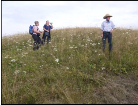
Oben: Auf dem Runden Berg; unten: Streifenwanzen auf fruchtendem Berghaarstrang

das jedoch auch ein Rückzugs- und Lebensraum verschiedener Tierarten. Beobachtet wurden eine Neuntötterfamilie und zwei Hasen.