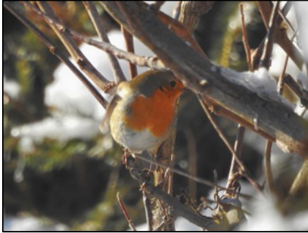
Oben: Rotkehlchen, Foto: Horst Niemann; unten: Reh, Foto: Manfred Schmidt

Die am weitesten entfernte Meldung kam aus Rangsdorf bei Berlin. Und was fand sich so alles am Futterhaus ein? Belegt sind insgesamt 18 Vogelarten. Auch zwei Sperber waren dabei. Die haben es sicher auf die futtersuchenden Kleinvögel abgesehen.