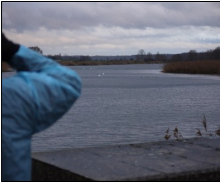
Blick auf das südlichste Zuwachsgewässer

Zu dritt ging es in den bis dahin niemand von uns bekannten Elbniederungsbereich. Die Erwartungen waren nicht besonders hoch, denn bei Temperaturen um drei Grad, Nieselregen und stürmischem Wind sollten sich die Vögel auch eher in geschützten Bereichen wie dem Röhrichtgürtel aufhalten.