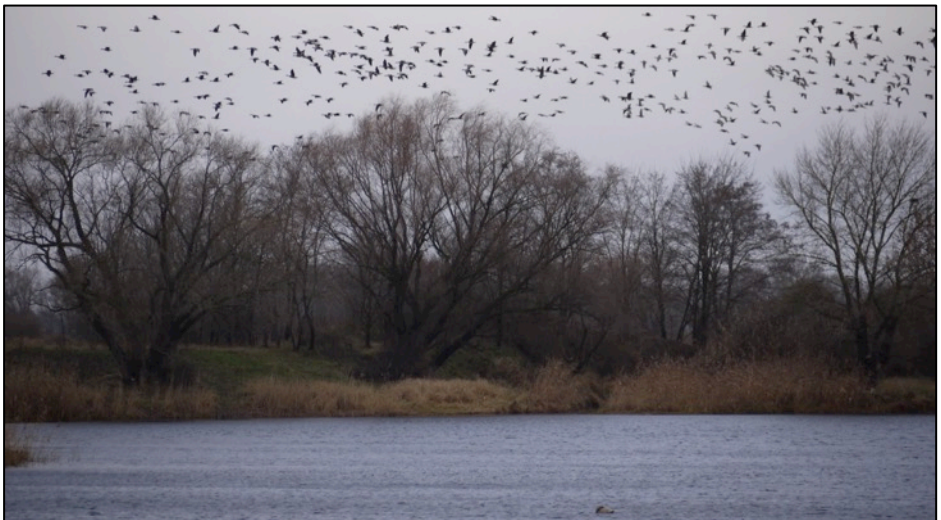
Oben: Biberschnitte; unten: Einfallende Gänse

Auf der Rücktour wurden auf einer Getreidefläche noch drei Blässgänse und etwa 30 Graugänse beobachtet.