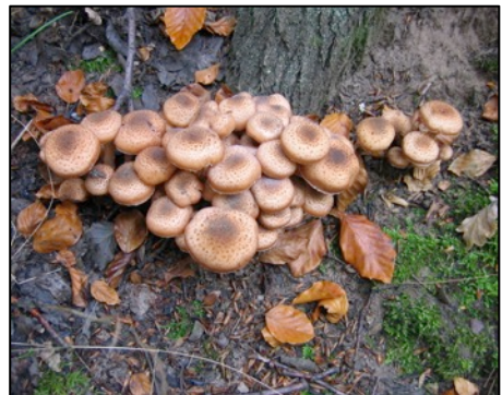
Links: Ziegenlippe; rechts: Hallimasch