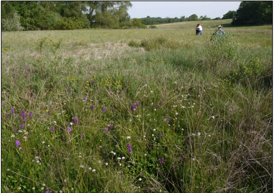
In der Krähenbruchwiese

wert war hier ein Vorkommen des sonst eher seltenen Kreuzlabkrauts. Zurück ging es durch den Waldbereich entlang des Grenzgrabens. Auffällig waren der rosablühende Stinkende Storchschnabel und die weißblühende Brunnenkresse, von der gekostet werden durfte. Zum Schluss wurde noch ein kleiner Abstecher in die nahen ehemaligen Tonkuhlen gemacht. Im Wasser wimmelten tausende Kaulquappen. Und am Ufer wurde das Große Zweiblatt (Orchidee) entdeckt. Während der ganzen Zeit wurden wir von Vogelgesängen begleitet: Zaunkönig, Pirol, Zilpzalp, Mönchsgrasmücke. Aus dem Nasswiesengebiet ist das Schwarzkehlchen bekannt. Und am Ende der Exkursion gab es noch den Wendehals zu hören.