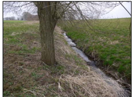
Naturferner Bachlauf der Krummbeek

Ganz anders war der Eindruck auf dem Rückweg. Zwar gibt es auch an der Krummbeek Baumreihen (vorwiegend Pappeln und jüngere Kopfweiden) und Wiesen. Die Krummbeek ist aber sicher begradigt und stellt sich als reiner Vorflutgraben dar. Ihre ökologische Verbindungsfunktion dürfte gering sein. Vielleicht rührte der nicht so positive Eindruck von der Krummbeek auch vom langsamer werdenden Schritt der Exkursionsteilnehmer gegen den Wind.