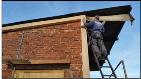
Während der Bauarbeiten

Fristgemäß konnte BUWATEC wesentliche Arbeiten abschließen. Wegen der Kurzfristigkeit standen speziell benötigte Verkleidungsbretter allerdings nicht rechtzeitig zur Verfügung. Diese und die geplanten Fledermauseinflughilfen konnten jedoch rechtzeitig bis zum Frühjahrsbrutbeginn nachgerüstet werden.