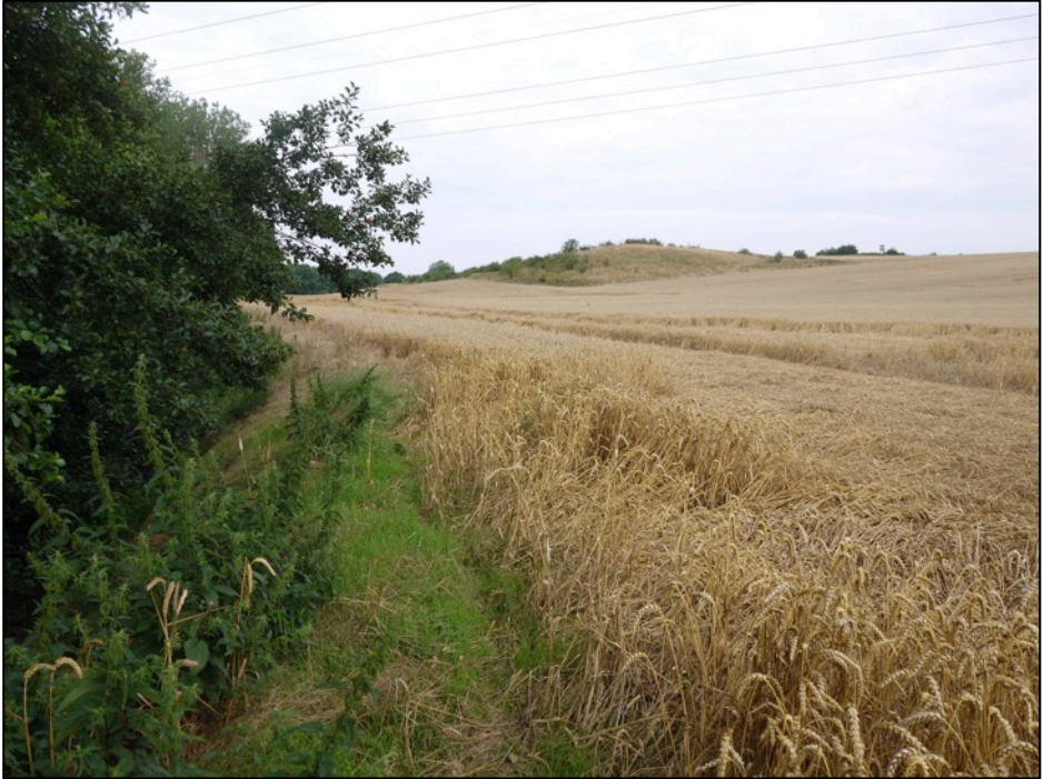
Blick auf den Runden Berg bei Alleringersleben

Aus unserer bisherigen Exkursionstätigkeit sind verschiedene Standorte mit Trocken- und Halbtrockenrasenvegetation am Nordrand der Allertalstörung bekannt. Wiederholt hatten wir den Steinberg bei Ostingersleben und den Generalsberg bei Groß Bartensleben besucht. Aber was ist mit den im Acker liegenden Kuppen dazwischen? Das wollten wir uns am 31. Juli ansehen. Unser Exkursionsziel hieß: Lange Berge Alleringersleben.