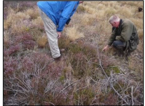
Oben: Bei der Suche nach Calluna-Jungpflanzen; unten: „Heideweg“

die Blüten noch richtig öffnen und das leuchtende Lila die Flächen prägt, musste bezweifelt werden.