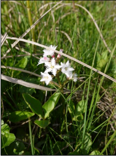
Oben: Fieberklee; unten: Breitblättriges Knabenkraut