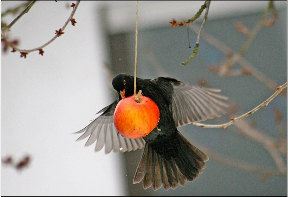
Amsel am Futterapfel

Zum Jahreswechsel hatten wir zu einem kleinen Fotowettbewerb aufgerufen. Wir baten Sie, uns Ihre Beobachtungen an Ihrem winterlichen Vogel-Futterplatz mitzuteilen und dies mit einem oder mehreren Fotos (Spitzenfotoqualität war nicht erforderlich) zu belegen.